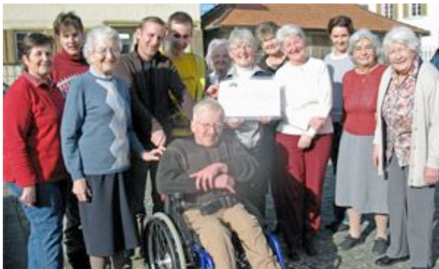
Spendenübergabe Frauenverein Sulgen für andante Eschenz

Allen grossen und vielen kleinen Spenderinnen und Spendern ganz herzlichen Dank für die Unterstützung!