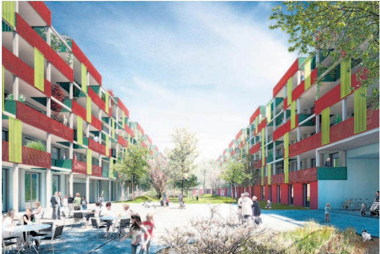
Pionierprojekt oder Untergang? Die Pläne der Baugenossenschaft Gesewo für ihr Generationenhaus an der Ida-Sträuli-Strasse in Neuhegi scheiden die Geister.